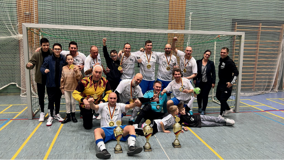
Dreifach-Sieg – Dreifach gefeiert