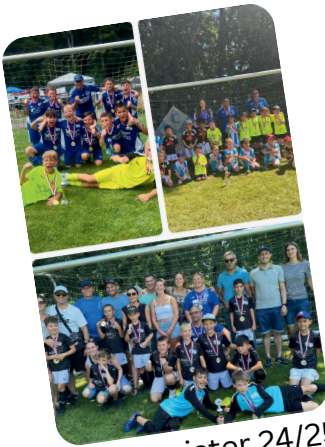
Stadtmeister 24/25 (G-/F- und E-Jugend)