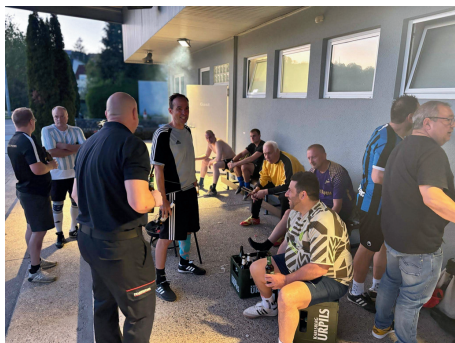
Fußball, Freunde, Feierabend –