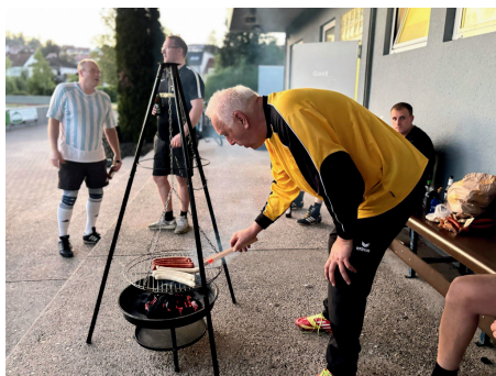
Unsere AH beim spontanen Grillen